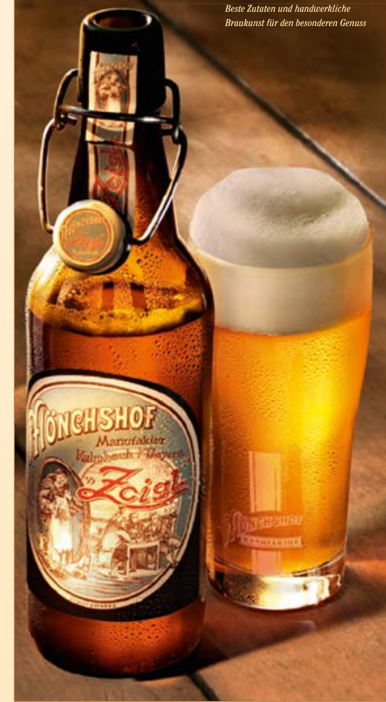
Beste Zutaten und handwerkliche Braukunst für den besonderen Genuss