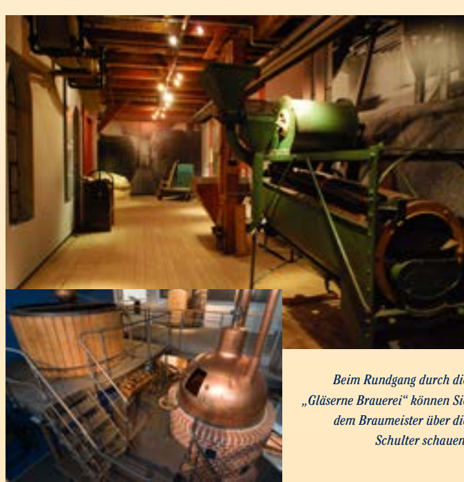
Beim Rundgang durch die „Gläserne Brauerei“ können Sie dem Braumeister über die Schulter schauen.

INFOS ZUM BAYERISCHEN BRAUEREIMUSEUM: Öffnungszeiten: Di - So jeweils 10-17 Uhr Führungen nach Vereinbarung Telefon: 09221 / 805 14